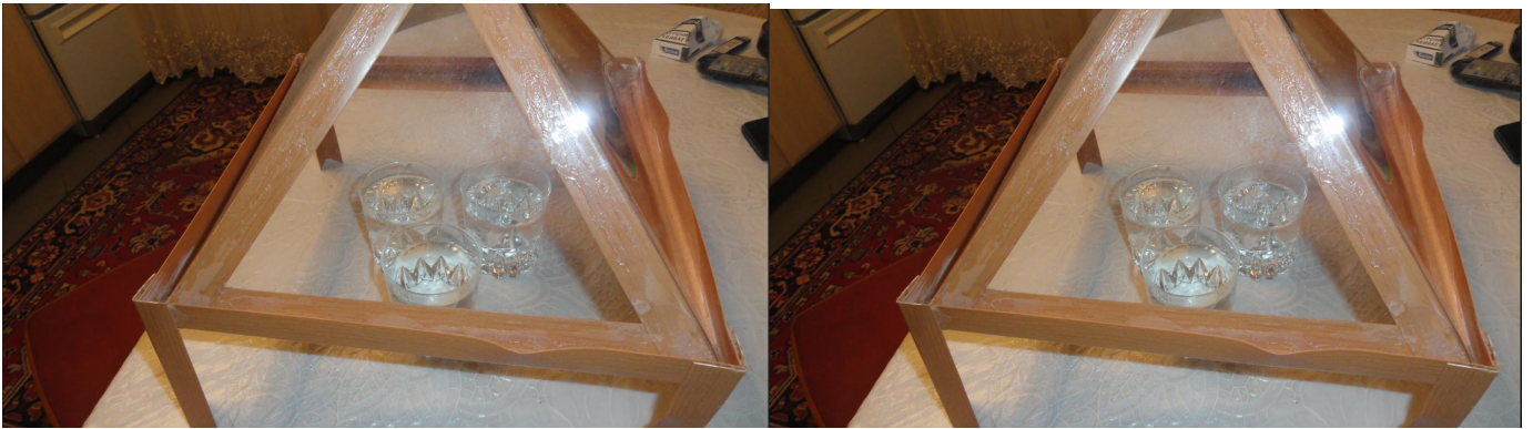
Приготовление пирамидальной воды.

Один из самых эффективных способов лечится данной пирамидой.