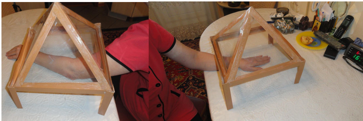
Лечение локтевого сустава под пирамидой.

https://www.youtube.com/watch?v=gIbm_K3u8I